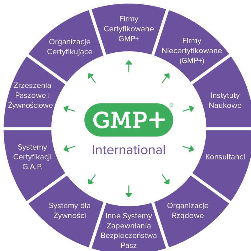
[ rysunek: interesariusze Wspólnoty GMP+ ]